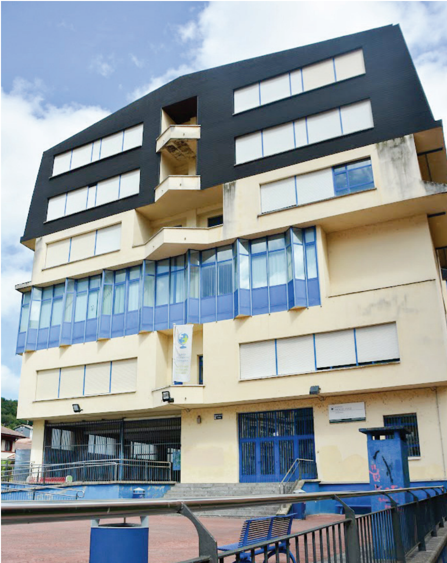
Eibarko Mogel Isasiko gurasoak kritiko agertu ziren fusioarekin: "Aniztasunari modu inklusiboan erantzutea ez da soilik eskola desberdinetako ikasleak ikastetxe berean batzea. Zein baliabide gehigarri jarriko da aniztasun horri erantzuteko?"

Ildo berean, segregazioari aurre egiteko neurria izango ei dela-eta, Isasi Mogelego gurasoen hitzekin akordatu gara. Eibarko ikastetxea duela kasik hamar urte fusionatu zen, eta hala mintzo ziren gurasoak, orduko prentsan, proiekturik gabeko bateratze hutsa zela salatuta: "Aniztasunari modu inklusiboan erantzutea ez da soilik eskola desberdinetako ikasleak ikastetxe berean batzea. Zein baliabide gehigarri jarriko da aniztasun horri erantzuteko?"